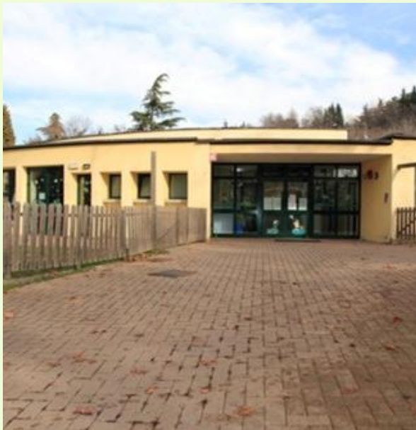
Scuola dell'infanzia Bellini in Via Emilia Romagna 136 cod. mecc. MOAA81401B