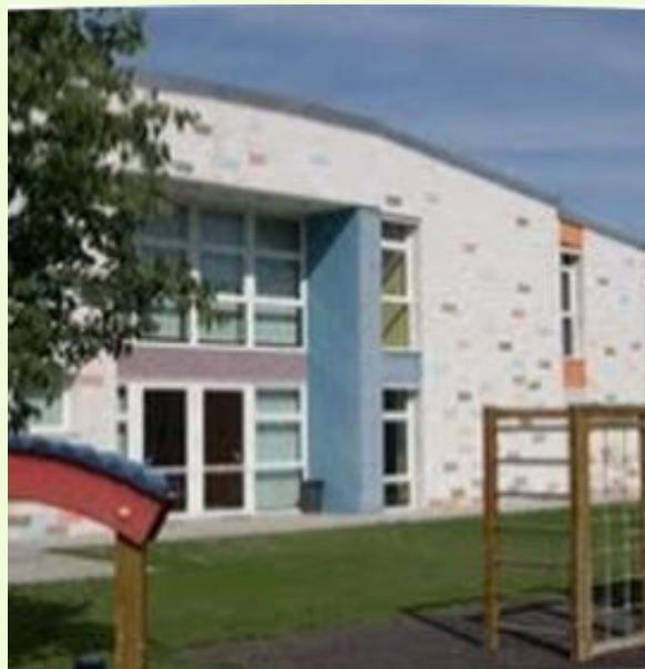
Scuole dell'infanzia Puglisi in Via N. Marchi 190 Loc. Mulino cod. mecc. MOAA81403D